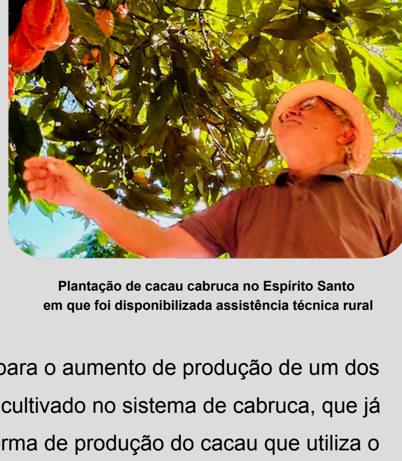
Plantação de cacau cabruca no Espírito Santo em que foi disponibilizada assistência técnica rural