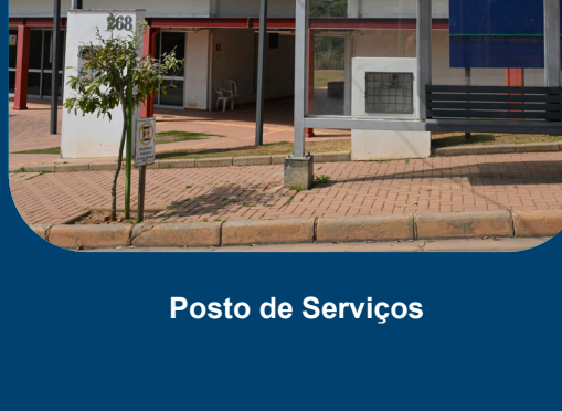
Posto de Serviços