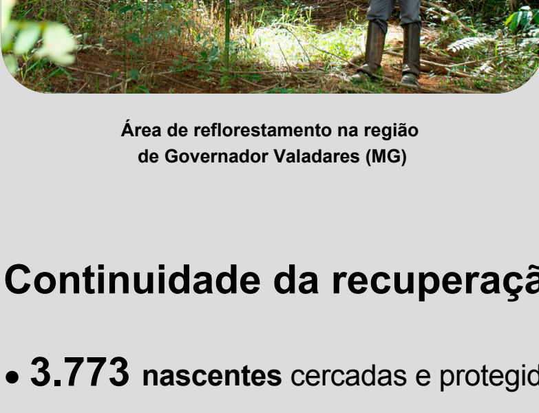
Área de reflorestamento na região de Governador Valadares (MG)