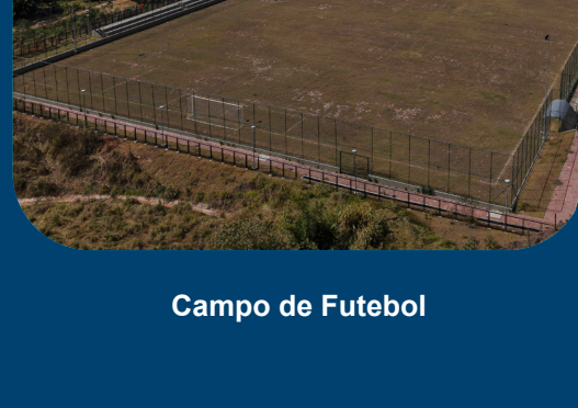
Campo de Futebol

Bens públicos entregues em Novo Bento Rodrigues e Paracatu.