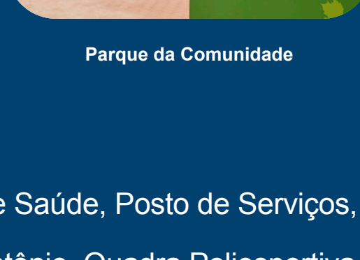
Parque da Comunidade