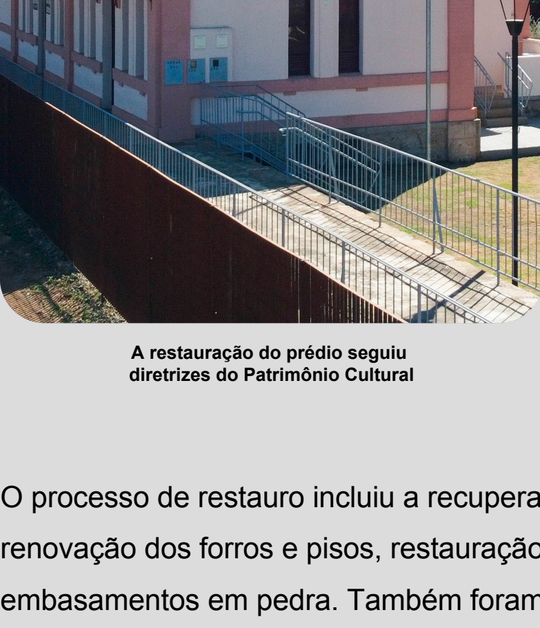
A restauração do prédio seguiu diretrizes do Patrimônio Cultural