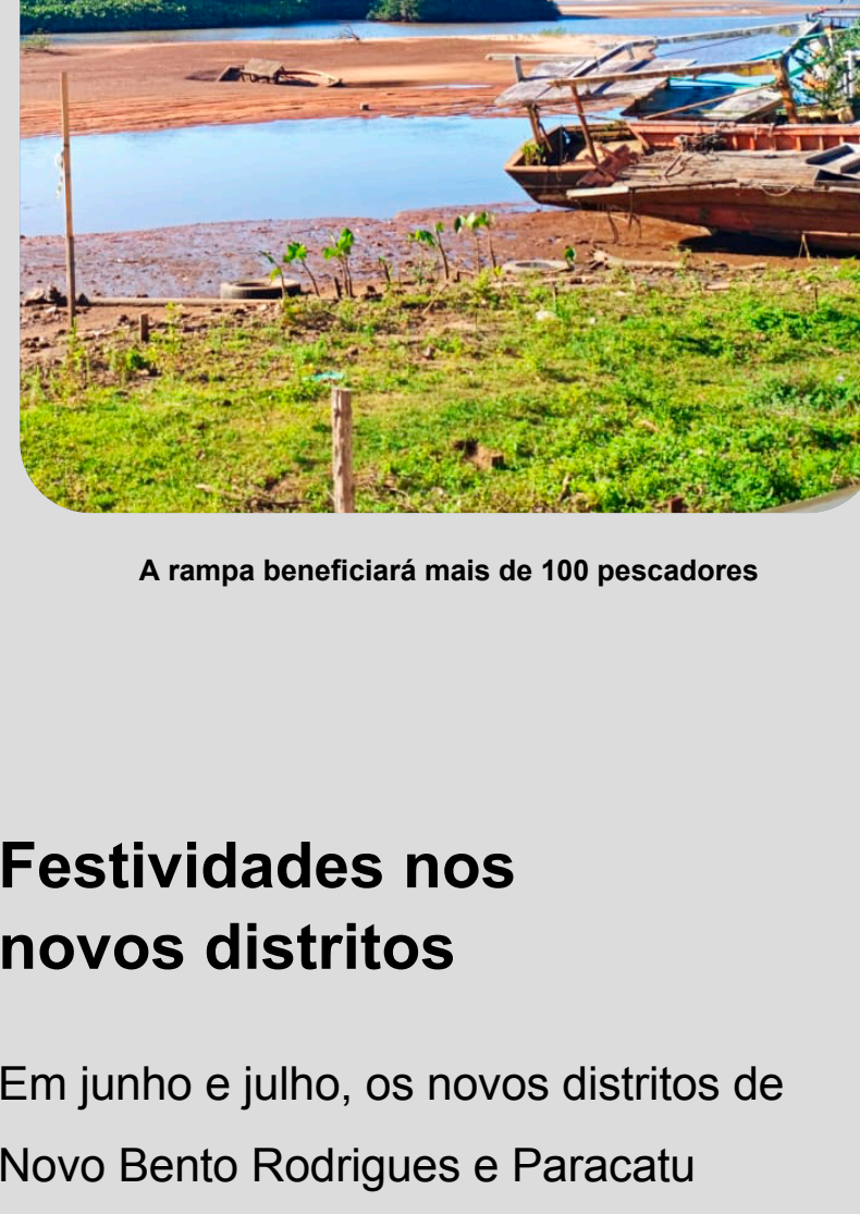
A rampa beneficiará mais de 100 pescadores

Em julho, foi assinada a cessão de espaço físico em águas públicas entre a Secretaria de Patrimônio da União (SPU) e a Associação de Pescadores de Regência (ES) Pescador Sabino Bispo de Oliveira (ASPER), para que possa ser construída uma rampa de acesso de barcos no distrito. A iniciativa beneficiará os mais de 100 associados da entidade e a obra será executada pela Samarco, com previsão de entrega até o final deste ano.